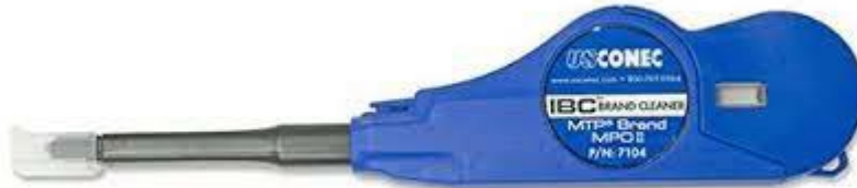
MTP® ist ein eingetragenes Warenzeichen von US-Conect Ltd.